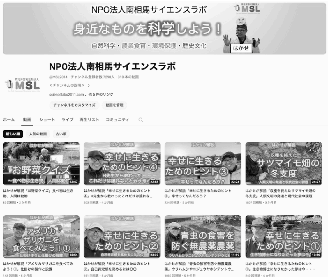
図3 当法人のYouTubeチャンネル（チャンネル登録者7,290人）