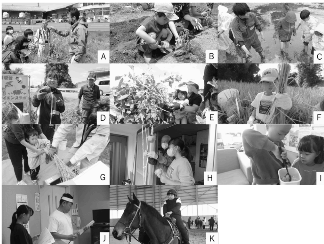
図1 南相馬市内で開催した親子農業食育教室・親子歴史文化たんけん教室・親子ふれあい乗馬体験教室

A. 春の植物を見てみよう！ B. 野菜の苗を植えてみよう！ C. 田植えをやってみよう！ D. 夏野菜カレーをつくろう！ E. 枝豆の収穫 F. 稲刈りをやってみよう！ G. 足踏み脱穀をやってみよう！ H. 干し柿を作ろう！ I. お味噌を作ろう！ J. 報徳仕法ってなんだろう？ K. 親子ふれあい乗馬体験教室